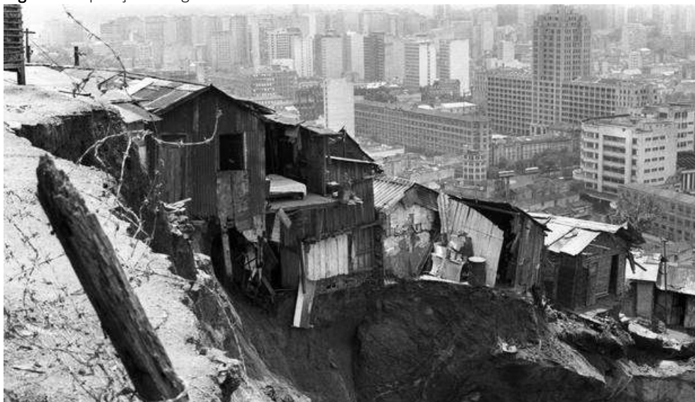
Figura 1. Exposição fotográfica “Morro da Favela à Providência de Canudos”

Para agravar a situação, as tropas advindas do conflito de Canudos em 1897, sem local para se estabelecer na cidade do Rio de Janeiro, foram ocupar principalmente os morros, em especial o da Providência, no centro da cidade, passando a chamá-lo de Morro da Favela, alusão a um morro existente na região de Canudos. O nome “favela” acaba virando sinônimo deste modelo de moradia e outros morros ocupados passam a receber essa alcunha. Nos anos 50 e 60, foi a vez do êxodo rural e regional ser responsável por mais um inchaço nas metrópoles brasileiras. Os nordestinos e nortistas vieram para o “sul maravilha” em busca de oportunidades, fugindo da miséria, da fome e da seca, concentrando-se em sua maioria nos morros e nas periferias (Naiff; Naiff, 2005, p. 110).