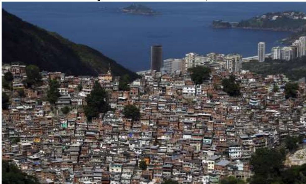
Figura 2. Rocinha: maior favela do país.