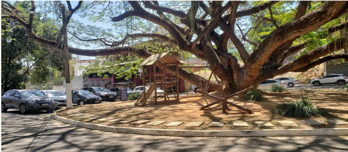
Figura 2 - Praça dos Macacos