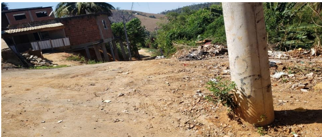
Figura 3 - Rua Quilombo, Alto Bela Vista.

Nesse sentido, veja-se as figuras 3,4 e 5, dos bairros Alto Bela Vista e União, característicos por serem bairros periféricos, subdesenvolvidos e construídos às encostas dos morros.