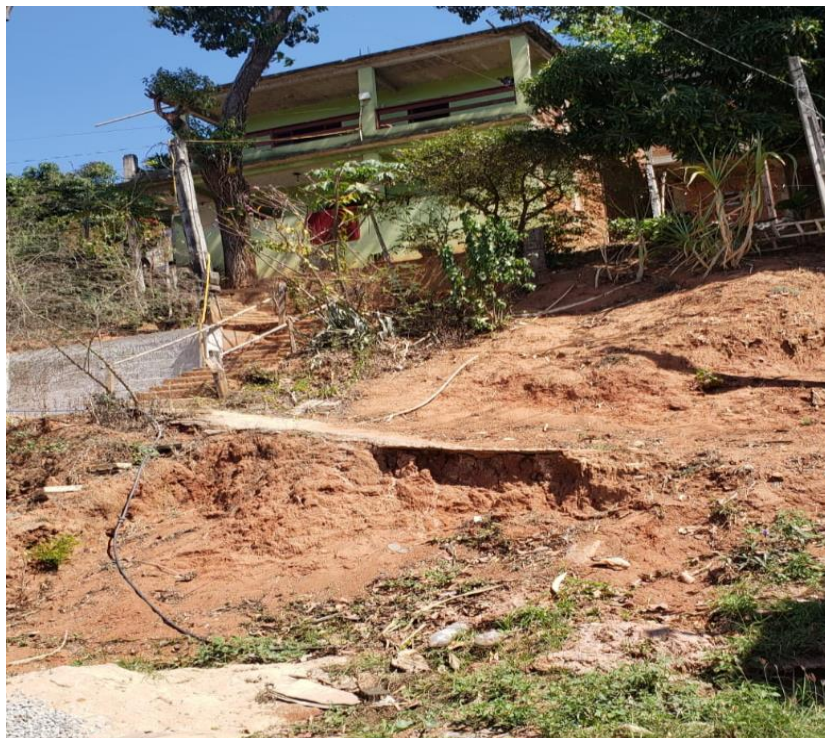
Figura 5 - Rod. Eng. Fabiano Vivacqua. BR- 482. Parte de baixo do bairro União.